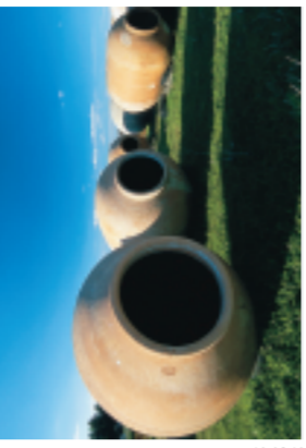
Trajales en Villarrobledo, Albacete.

Plaza Mayor de Villanueva de los Infantes, Ciudad Real.