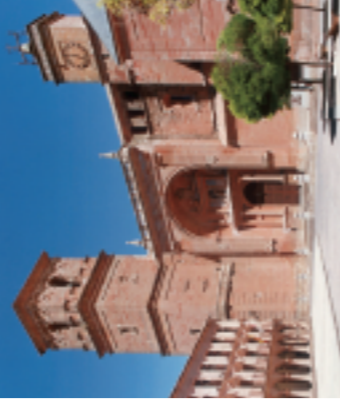
Plaza Mayor de Villanueva de los Infantes, Ciudad Real.