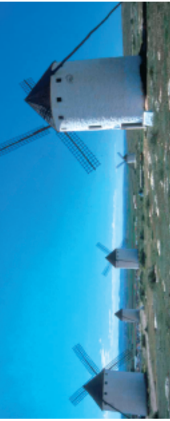
Molinos en Campo de Criptana, Ciudad Real.

Estos parajes no sólo nos permiten conocer alguno de los conjuntos monumentales más importantes de La Mancha, sino también acercarnos a una de las mayores extensiones lagunares españolas, paso imprescindible de las aves migratorias en su viaje entre Europa y África.