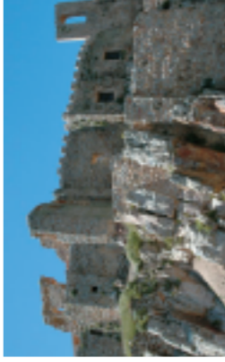
Sacro convento-castillo de Calatrava la Vieja, Ciudad Real.

modovar del Campo. También allí hay importantes yacimientos paleolíticos, como los de la laguna de Retamar. Tras girar en La Nava hacia el norte, terminamos nuestro recorrido en Corral de Calatrava, atravesando un paisaje en el que pueden verse los cráteres y elementos volcánicos más importantes de la comarca.